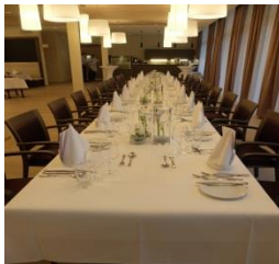
Restaurant Le S