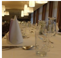
Restaurant Le S